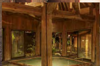
【塗澤之湯】 室內溫泉

2001年建造的繩文庭園浴池， 位於繫溫泉的西側，是一個以珍貴的遺蹟群 「葦內遺蹟」為主題的浴池。 讓人聯想起古老的繩文時代的風情是其魅力所在。