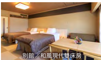
別館／和風現代雙床房