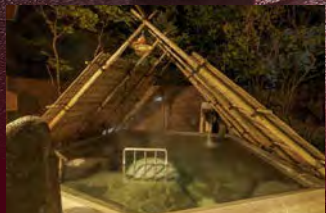
【葦內之湯】 石頭圍之湯(露天)