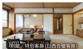
別館／特別客房(日西合璧客房)