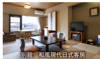
別館／和風現代日式客房