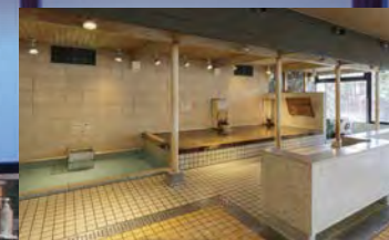
【愛之湯】 託瑪琳・源泉扁柏・熊貓・河童浴池

「真心之湯」、「愛之湯」 分別有寬敞的大浴池與扁柏浴池及三溫暖等 各五種情趣的浴池， 可享受串遊浴池的樂趣。