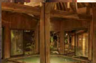
【ぬりさわの湯】 内湯

二〇〇一年に造られた庭園縄文風呂は、 つなぎ温泉の西に位置する貴重な遺跡群 「稗内遺跡」をモチーフにしたお風呂です。 いにしへの縄文時代を彷彿させる趣が魅力です。