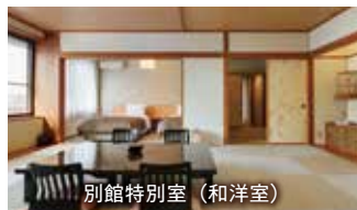
別館特別室 (和洋室)