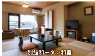
別館和モダン和室