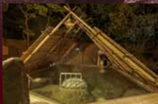
【しだないの湯】 ストーンサークルの湯(露天)