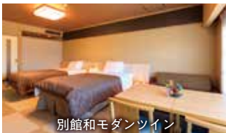
別館和モダンツイン