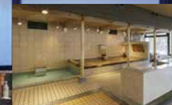
【あいの湯】 トルマリン・源泉檜・バンダ・カップ風呂

「まごころの湯」・「あいの湯」 それぞれに広々とした大浴槽と檜風呂・サウナなど、 各五趣の浴槽があり、 お風呂のはしごをお楽しみいただけます。