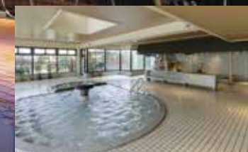
【まごころの湯】 大浴槽